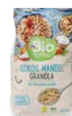
dmBio GRANOLA 500 G