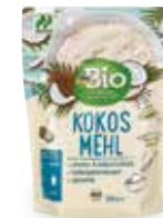
dmBio KÓKUSZLISZT 300 G