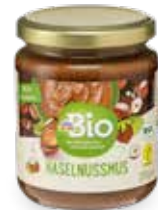
dmBio MOGYORÓKRÉM 250 G