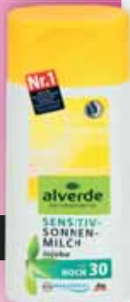
alverde naptej F30 200 ml