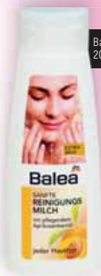
Balea arctisztító tej 200 ml